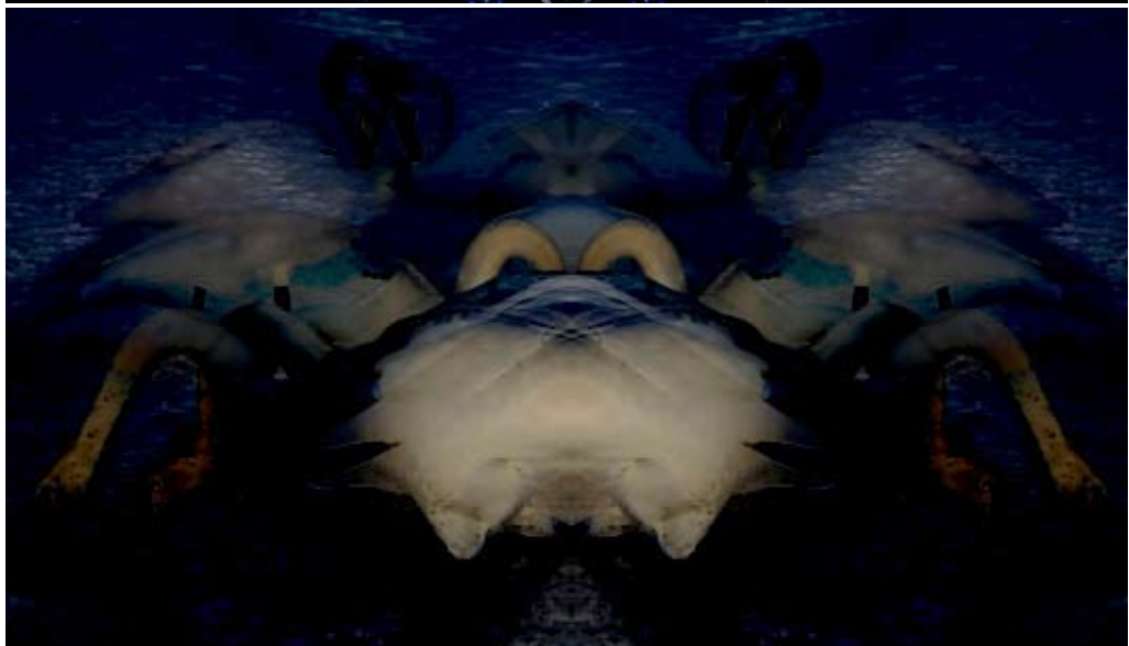
Schwanenseh. Im Vordergrund Krieg.